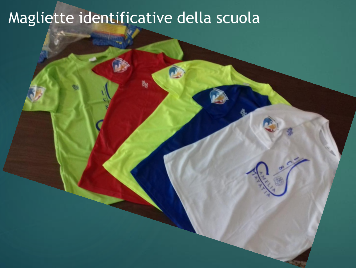
Magliette identificative della scuola