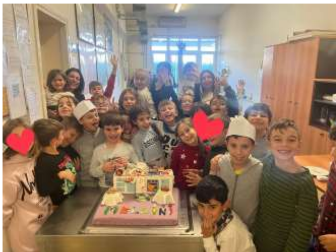
TORTA SCUOLA PRIMARIA MELLINI